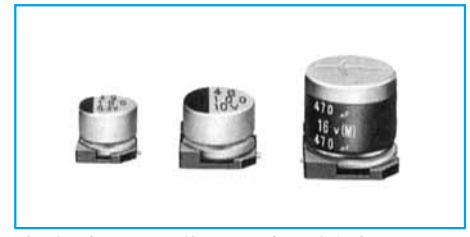
表示色：高さ10mmL以外はケース頭部に黒色印刷 高さ10mmLは茶色スリーブに白色印刷