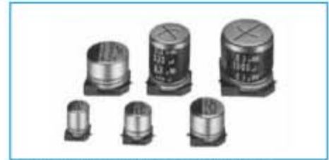
表示色: φ4×5.3L~φ8×6.5L はケース頭部に黒色印刷 φ8×10L~φ10×10.5L は茶色スリーブに白色印刷 φ12.5×13.5L はケース頭部に黒色印刷