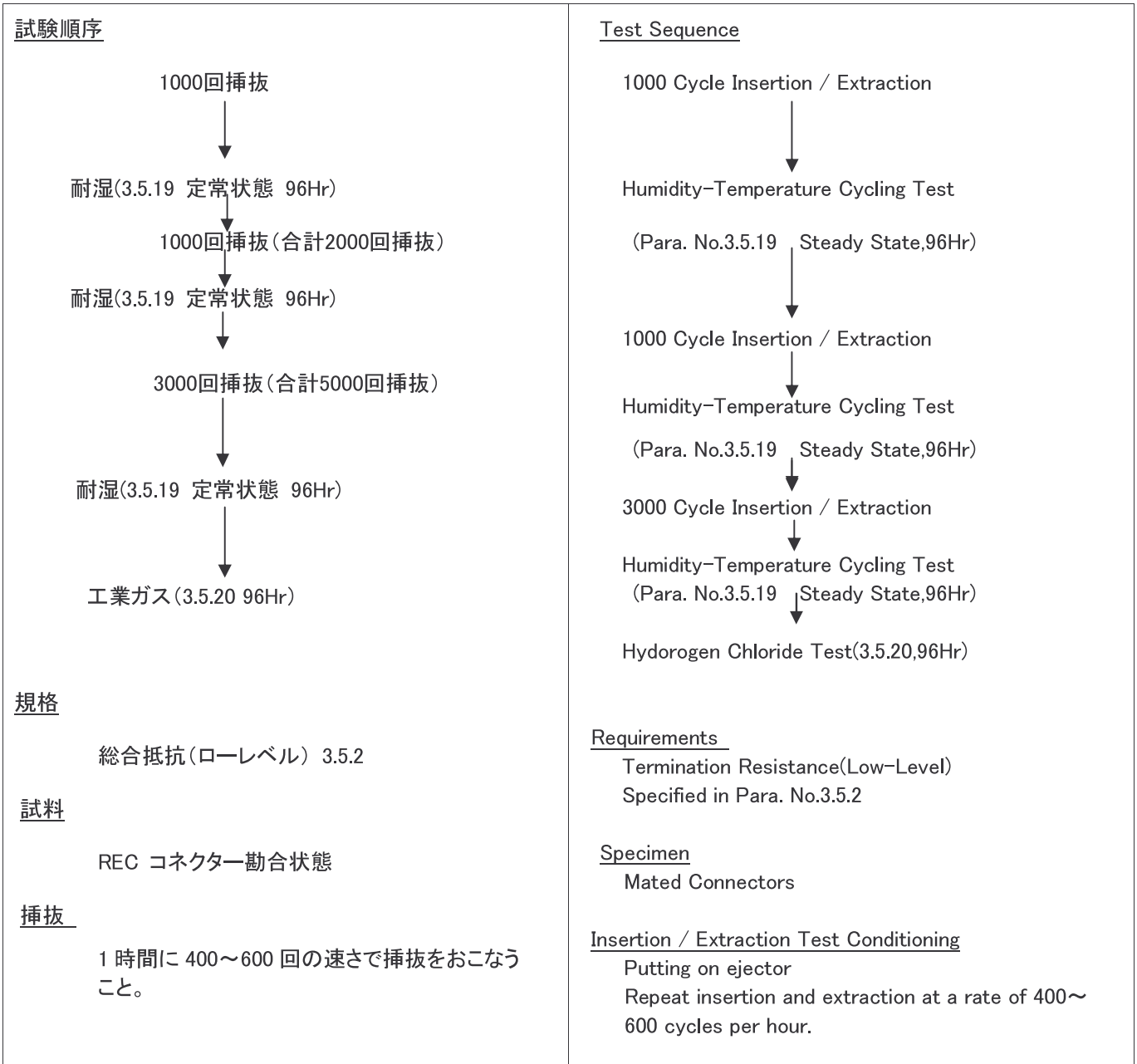
Fig.3 挿抜耐久性(オフィス外環境 5000 回) Fig.3 Durability Test (Harsh Environment)