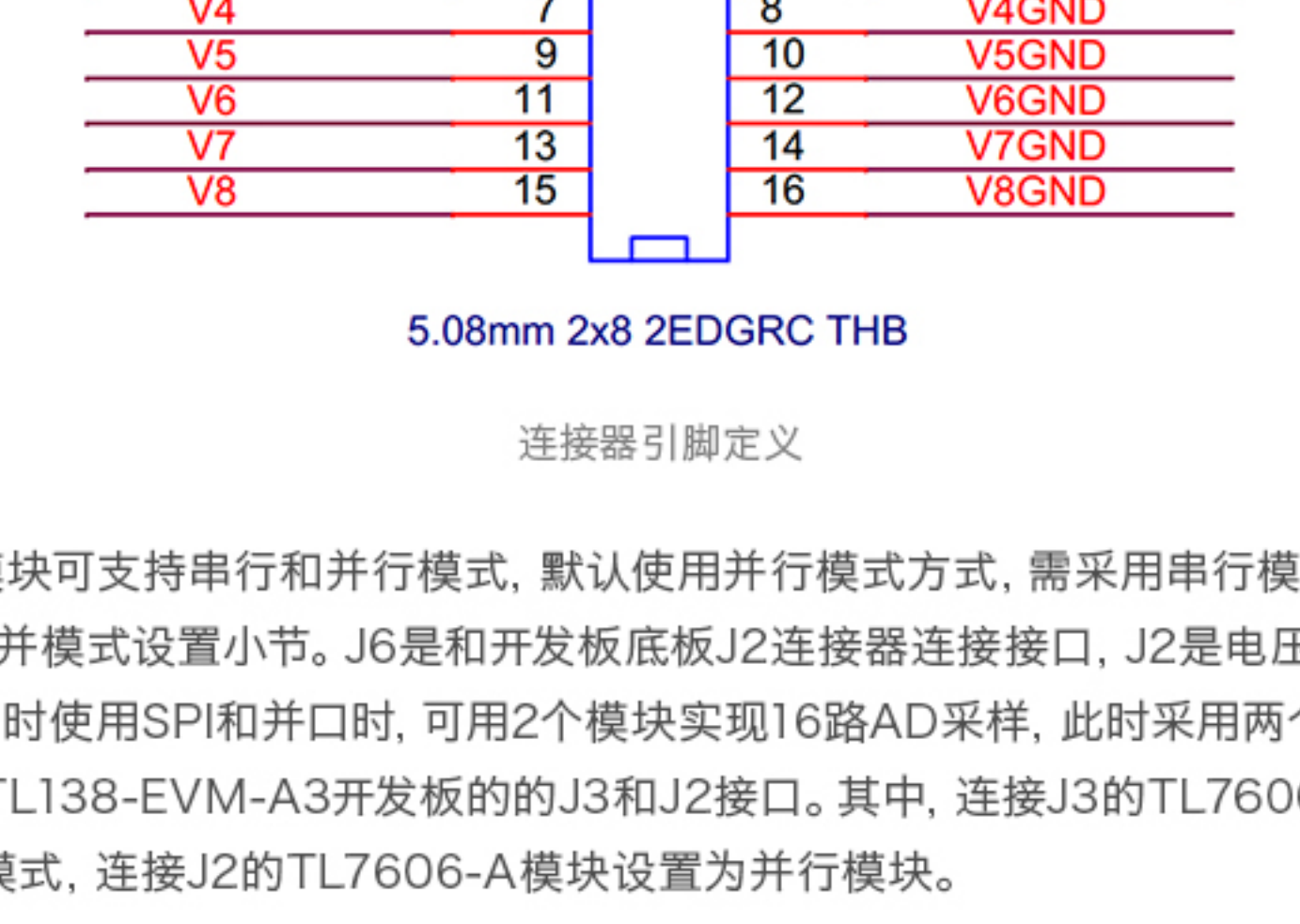
5.08mm 2x8 2EDGRC THB 连接器引脚定义

备注： 本模块可支持串行和并行模式，默认使用并行模式方式，需采用串行模式，请参考下面的串/并模式设置小节。J6是和开发板底座J2连接器连接接口，J2是电压信号输入接口。在同时使用SPI和并口时，可用2个模块实现16路AD采样，此时采用两个TL7606-A模块连接TL138-EVM-A3开发板的J3和J2接口。其中，连接J3的TL7606-A模块设置为串行模式，连接J2的TL7606-A模块设置为并行模式。