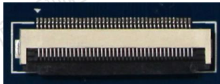
图 7 CON2 接口（40pin FFC 连接器，背面）